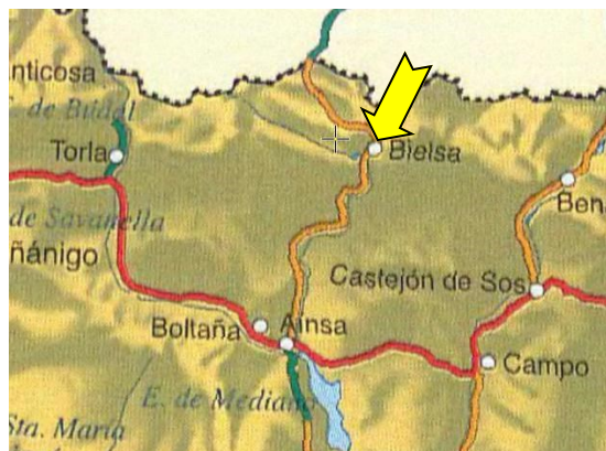
Parzán se encuentra al lado de Bielsa, en el Pirineo Aragonés.